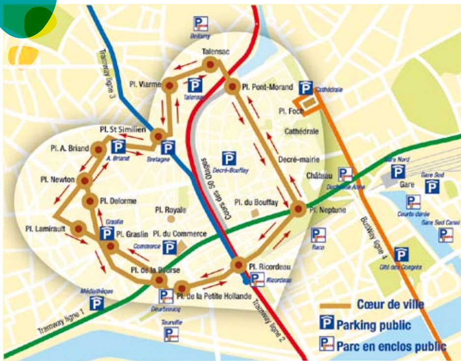
COEUR DE VILLE - CAR PARKS